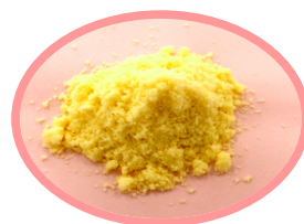
ハッピー スイート

はちみつを粉末で再現しました。甘〜いはちみつそのものです。ラスクやポップコーンなどにいかがでしょうか。